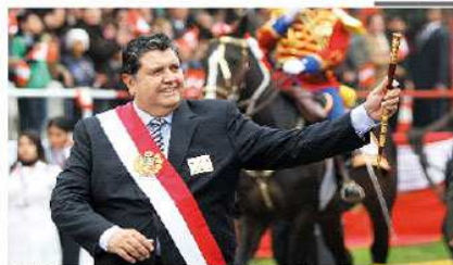
DESFILE. Presidente García se dio un baño de popularidad en el desfile militar por el aniversario patrio.

El 2009 dijo que debían investigarse los cambios que afectaron el mercado nacional, pero en su último mensaje defendió la exportación. Al final los peruanos pagarán más Pág. 12